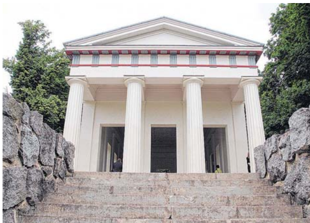
Ein Feierort der Extraklasse ist das Belvedere über dem Tollenseesee. Auch in diesem Jahr wird es wieder eine „Sommernacht auf Belvedere“ geben, die sich seit Jahren großer Beliebtheit erfreut.

Die bekannteste Party der Stadt steigt wieder