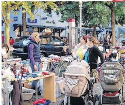
Alles rund ums Kind wird am 7. Mai wieder auf dem Boulevard präsentiert. Zum neunten Mal geht der Flohmarkt für die Kleinen über die Bühne.

NB-Kinderkram am 7. Mai in der Turmstraße