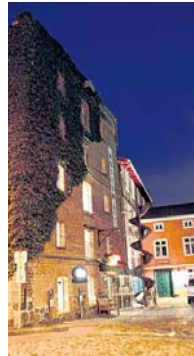
Beliebter Treffpunkt gerade nachts: die Vierrademühle.