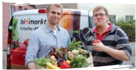
unser Lieferservice in der Stargarder Str. 5

Im Mai veranstalten wir in der neuen Packstation in der Stargarder Str. 5 (NB) einen Tag der offenen Tür. Dann haben Sie die Möglichkeit hinter die Kulissen unseres Lieferservices zu schauen. Natürlich haben wir einige Überraschungen für Sie vorbereitet. Genaue Termine gibt es Anfang Mai wie gewohnt oder auf www.biomarkt-nb.de . Wir freuen uns auf Sie.